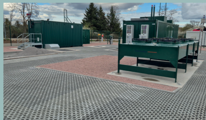
Rebours d'Yzeure (Allier)

— Développé par NaTran, le rebours permet de remonter le surplus de gaz renouvelable non consommé du réseau de distribution vers le réseau de transport.