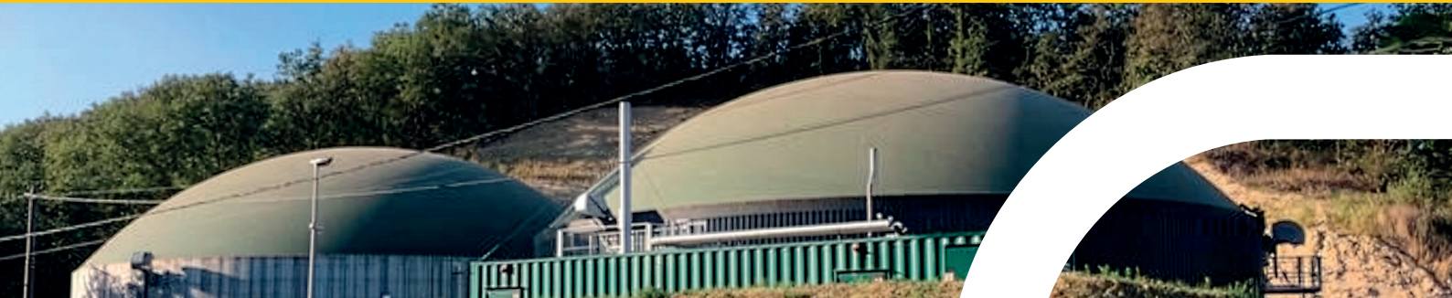
Unité de méthanisation à Vaunaveys-La-Rochette (26)